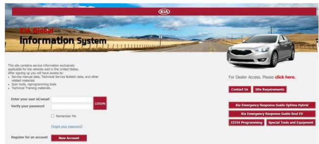
Strona rejestracji Kia

Raz jeszcze zaznaczmy że dostępna jest obecnie funkcja programowania dla Pojazdów Kia i Hyundai wyłącznie dla Pojazdów z rynku USA.