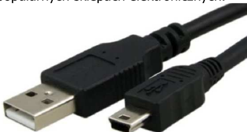
Kabel Mini B type (5 Pin)

Użyj kabla Mini B typ (5 Pin) aby połączyć tester Gscan2 z PC. To typowy standardowy kabel dostępny w popularnych sklepach elektronicznych.