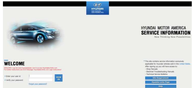
Strona rejestracji Hyundai

Aby pobrać pliki z danymi do programowania ECU wymagane jest dokonanie rejestracji.